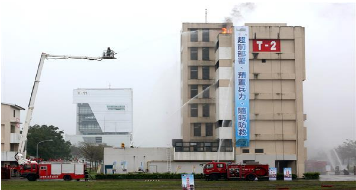
105 年度南投縣災害防救演習照片