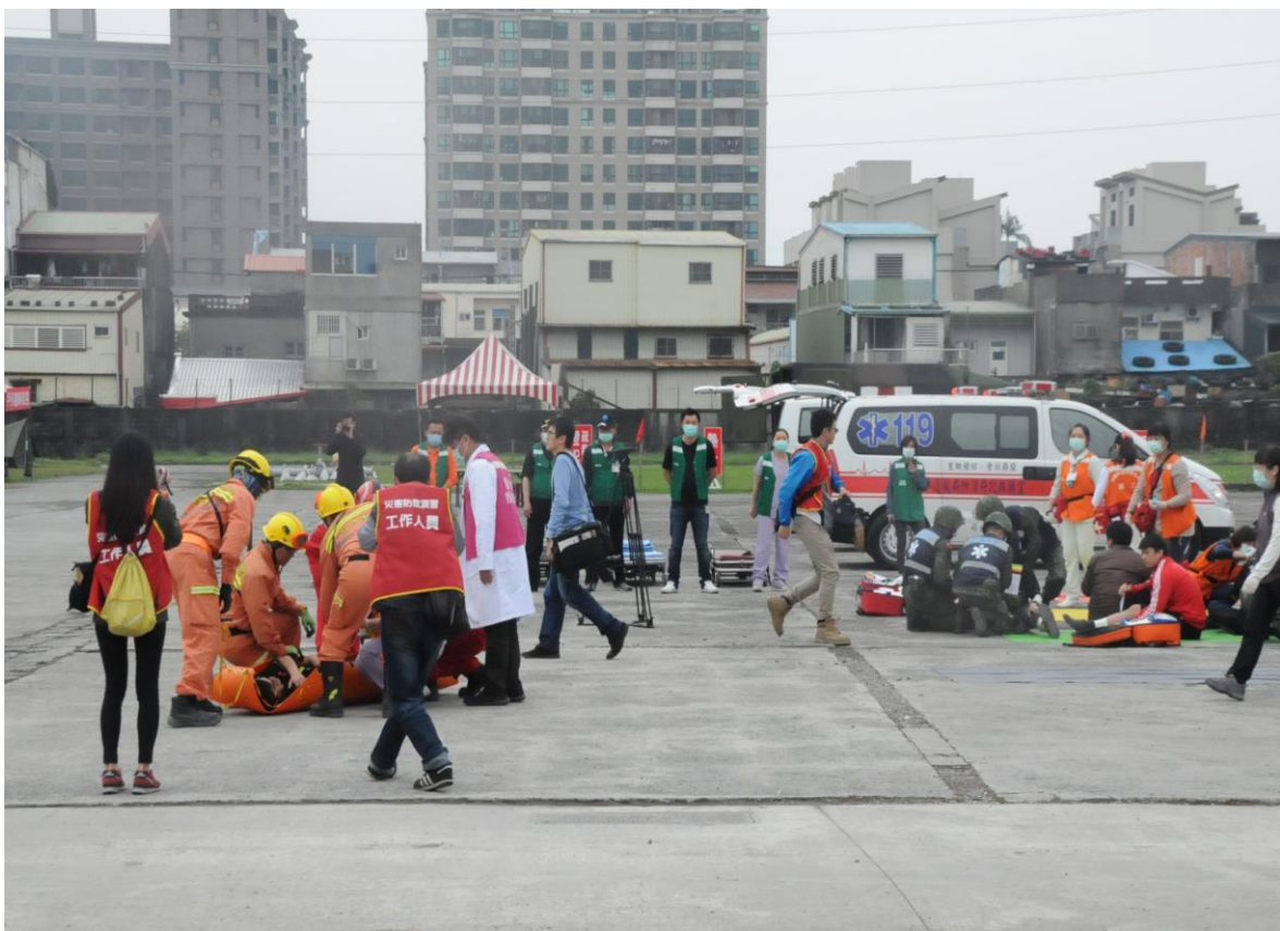
105 年度宜蘭縣災害防救演習照片