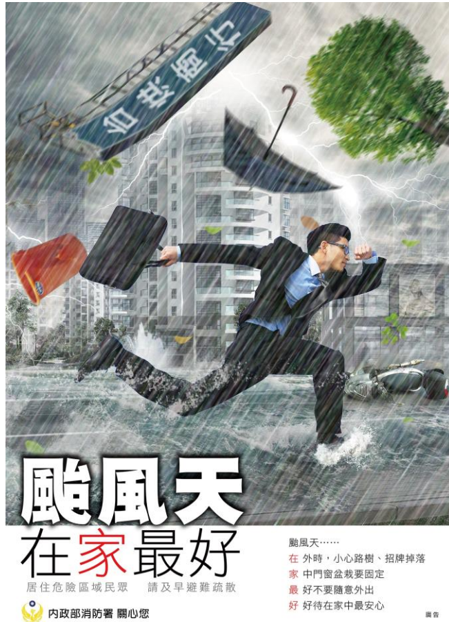
消防署製作防颶宣導海報